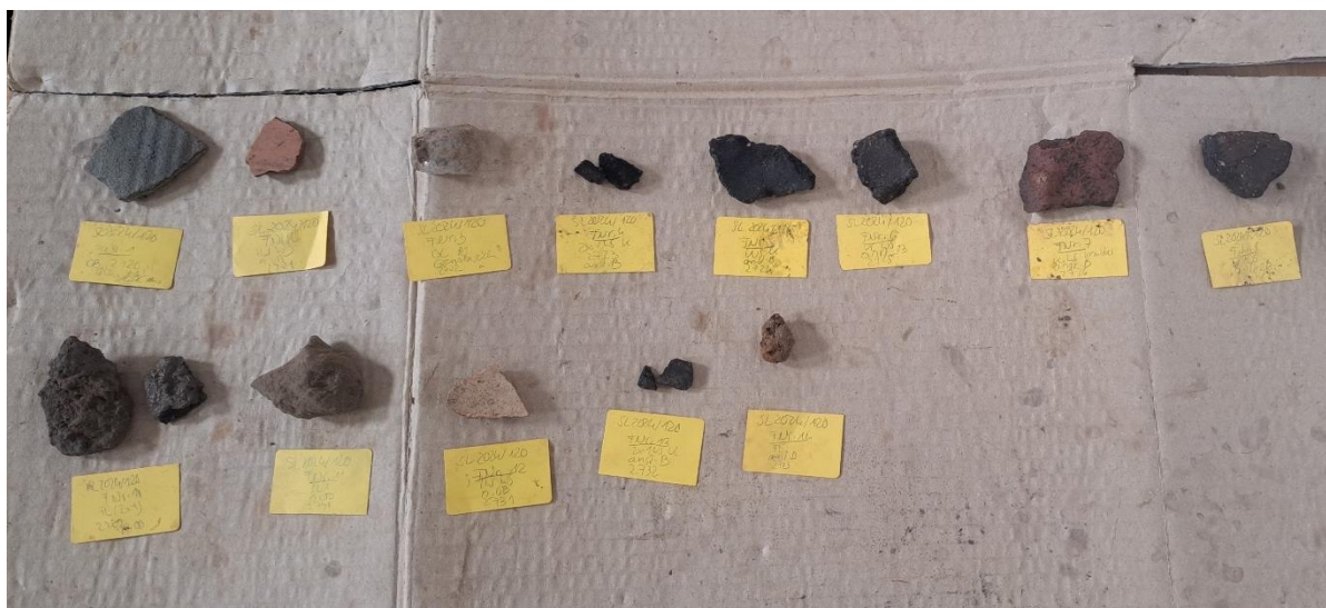
Abbildung 4: Evesen FSTNr. 28. Übersicht einiger der zum Trocknen ausgelegten Keramikfunde.

Im Juni fanden vier Praxiskurse für Sondengänger:innen in Bad Nenndorf (Ldkr. Schaumburg) und in Eystrup-Mahlen (Ldkr. Nienburg/Weser) statt.