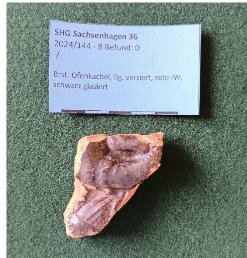
Abbildung 2: Sachsenhagen FStNr. 36. Bruchstück einer schwarzglasierten, figürlich verzierten Ofenkachel.

am Sportplatz fand die archäologische Suche nach Funden statt - tatsächlich waren einige Silexartefakte und ur- und frühgeschichtliche Keramik als Lesefunde zu verzeichnen ( Stöckse FStNr. 94 ).