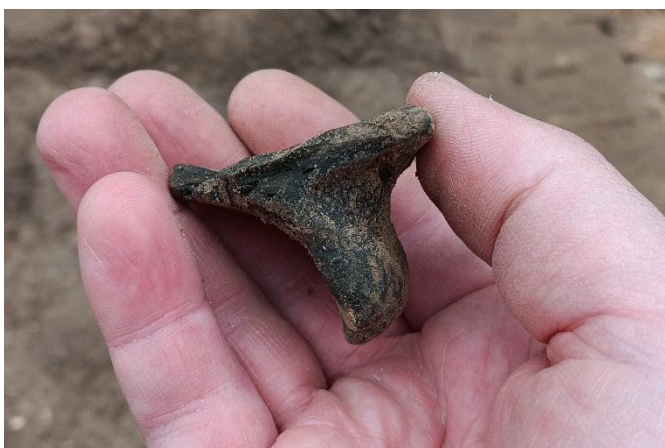
Abbildung 3: Wiedensahl FStNr. 20. Bodenbruchstück mit sog. Standlappen einer spätmittelalterlichen Grauware (dat. 13./14. Jh.).

Am 17. Juni begleitete die Grabungstechnikerin der KASL die Erdarbeiten für die Errichtung eines Wohnhauses in der Eveser Straße in Bükeburg. Bodenbefunde wurden nicht beobachtet, dafür konnten jedoch einige Lesefunde gemacht werden. Unter den Funden waren einige Stücke einer ur- und frühgeschichtlichen Keramik, die eine neue Fundstelle belegen ( Evesen FStNr. 28 )