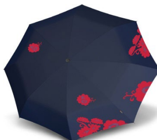
Regenschirm 42,80 €

Alle Preise verstehen sich inkl. 19 % Mehrwertsteuer.