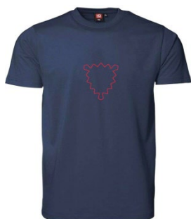
T-Shirt 25,00 €