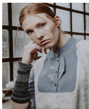
Stulpen (individualisierbar) 48,00 €

Die Preise beinhalten das Ausmessen, die Schnitthanpassung nach Maß, das Nähen, Stricken und Besticken. Die Leinenstoffe werden in Steinhude von der Fabrik Seegers & Sohn angefertigt. Die Kleidungsstücke und Accessoires werden im Atelier Nähwerk in Braunschweig einzeln angefertigt.